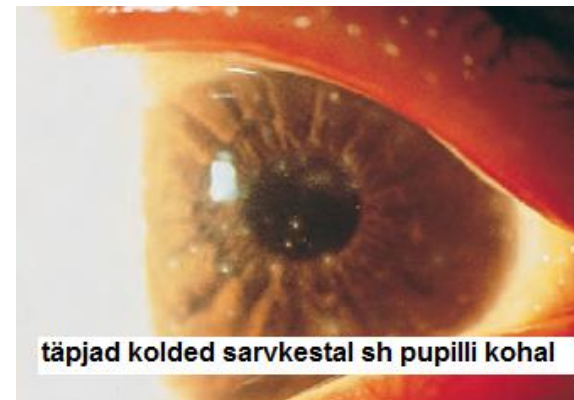
täpjad kolded sarvkestal sh pupilli kohal

Valvearstile tagasitulemine suurendab oluliselt teiste haiglas viibivate inimeste nakatumise riski ja viiruse levikut.