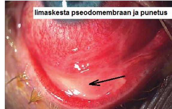
limaskesta pseodomembraan ja punetus

Hõõrumistunnet vähendavad erinevad niisutustilgad , soovitame kasutada säilitusainet mittesisaldavaid kunstpisaraid 4-8 korda päevas. Valu ja hõõrumistunnet aitavad leevendada ka suukaudsed valuvaigistid . Kui silm muutub rähmaseks, siis viitab see lisandunud bakteriaalsele nakkusele ning sel juhul on näidustatud antibiootilised silmatilgad/silmasalvid.