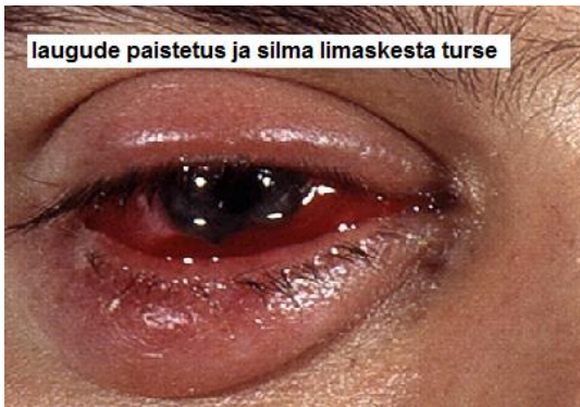
laugude paistetus ja silma limaskesta turse

Esmasteks sümptomiteks on silma kipitus ja hõõrumistunne , sageli kaasneb silma vesitsus . Üldjuhul süvenevad kaebused esimese haigusnädala jooksul, suurenevad silma punetus, laugude ja sidekesta turse (foto 1).