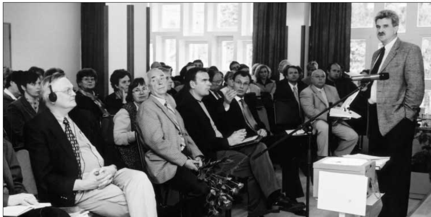
Jaak Nilsoni foto