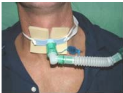
Трахеоканюля присоединенная к дыхательному аппарату.

Если пациент нуждается в длительном использовании дыхательного аппарата, производят процедуру – трахеостомию. Трахеостомия позволяет подключить дыхательный аппарат посредством трахеоканюли, которую вводят в отверстие дыхательного горла пациента.